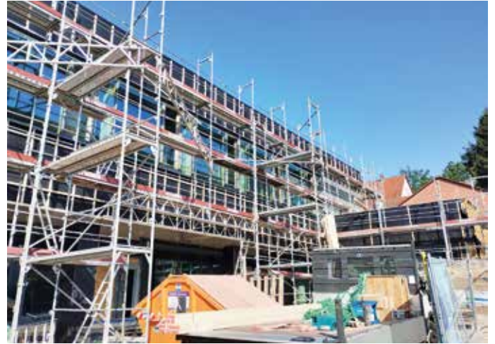
Der aktuelle Blick von der Friedrichstraße.