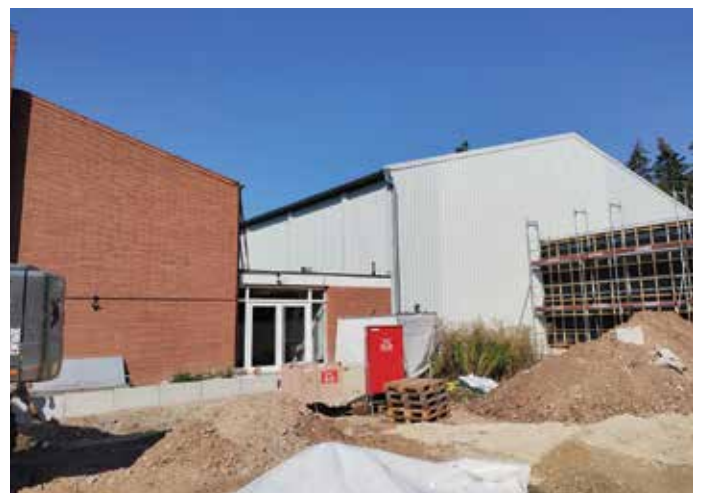
Übergang Außenanlagen KiTa zu Turnhalle.