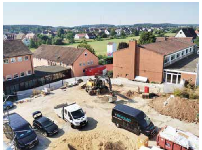
Der zukünftige Außenspielbereich ist noch Baustelle.