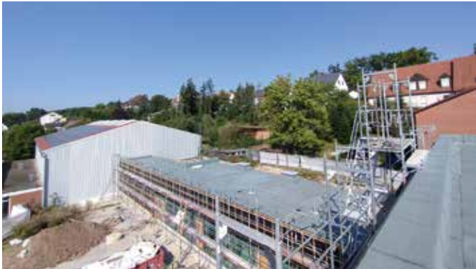
Die Krippe findet sich im eingeschossigen Riegel.