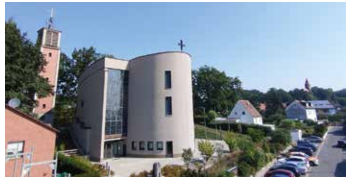
Blick vom Dach.