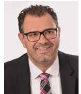
Marco Kistner 1. Bürgermeister