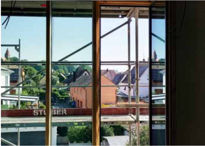
Blick aus dem neuen Hort.