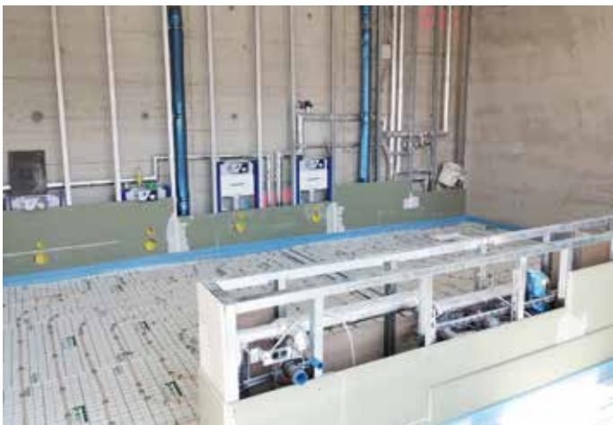
Zukünftiger Sanitärraum in der Kinderkrippe.

Im Eingangsbereich der benachbarten Turnhalle wird neben der neuen Treppe noch eine Rampe zur Sicherstellung eines barrierearmen Zugangs angelegt.