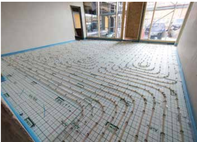
Hier entsteht ein Gruppenraum der Krippe.